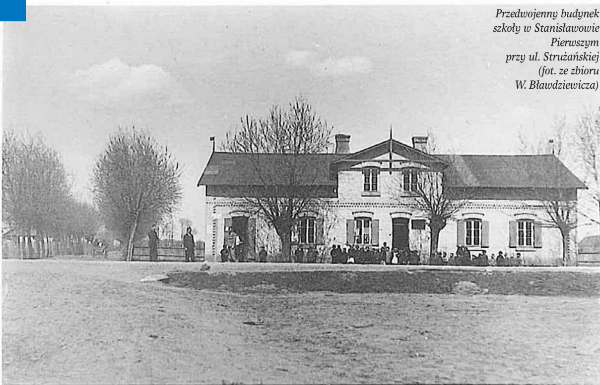
Przedwojenny budynek szkoły w Stanisławowie Pierwszym przy ul. Strużańskiej